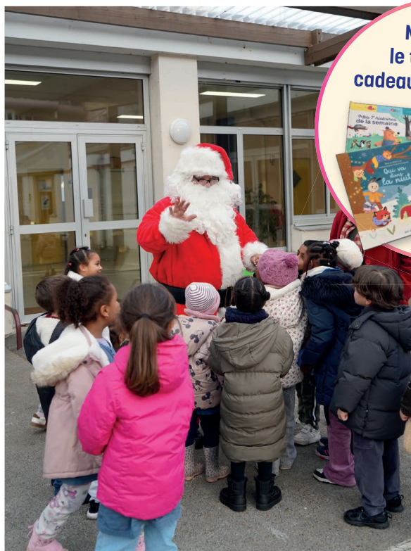
Passage du père Noël dans les écoles maternelles

Mais aussi le traditionnel cadeau de fin d'année